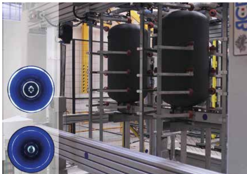
Una delle commesse realizzate da BCB electric prevedeva la necessità di rendere automatica la valutazione qualitativa della smaltatura in un'area della linea produttiva in cui i boiler risultano appesi tramite ganci su una guidovia